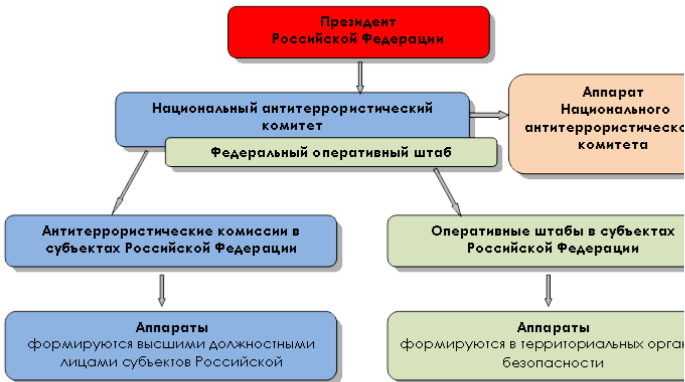
Схема координации деятельности по противодействию терроризму в Российской Федерации

Е ПЕРВОГО ЗАМЕСТИТЕЛЯ РУКОВОДИТЕЛЯ АППАРАТА НАЦИОНАЛЬНОГО АНТИТЕРРОРИСТИЧЕСКОГО КОМИТЕТА Е.П. ИЛЬИНА